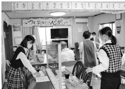
皆さんと力を合わせて頑張ったよ