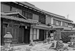
▲愛水館サロンの外観

どちらも地域のみなさまの力で生まれた居場所サロンです。お茶を飲みながら、レクリエーションをして、1日を楽しく過ごしてみませんか?