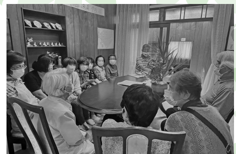
「おもてなしの日」の様子

また月に1回「おもてなしの日」を設けており、いつもよりも少し特別なお茶菓子を提供し、サロンを利用するきっかけづくりにも精力的です。ぜひお立ち寄りください。