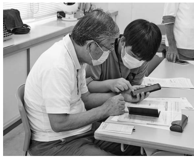
これを押すと、できますよ♪