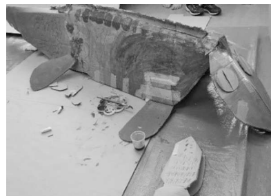
ダンボール工作「恐竜」