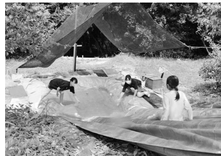
手作りすべり台 一緒に楽しむぞ～！