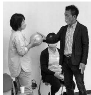
ボールでの感情表現のワーク