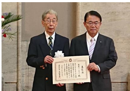
愛藍ハーモニー 表彰