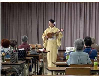
みんなで楽しく合唱！

10月11日(水)につつじが丘コミュニティでお楽しみ会が開催されました。第1部では保健センターの保健師によるお口のチェックとお口の筋トレ講習会でした。食前にお口の体操をするだけで、唾液の分泌を促し、誤嚥(ごえん)を防ぐことができます。