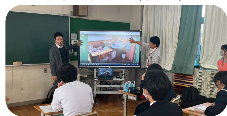
グループホームの様子の紹介

旭南中学校で特別支援学級の1～3年生が高齢者について学びました。今回は、ちた福寿園の職員が講師となり、高齢者の特徴や、ちた福寿園の施設などについて学びました。