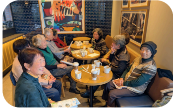
▲おしゃべりタイム

観音講で集まっていた女性たちが、毎月スターバックスコーヒー知多信濃川店でお茶会をしています。思いやりの時間とつながりを大切にする集まりが続いています。