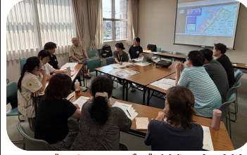
▲ハザードマップで地域の危険性を共有する様子

八幡地区は、「防災減災」をテーマに語り合いました。防災に関心がある地域住民の方、福祉事業所職員の方、そして、大船渡市在住の方とつながりました。